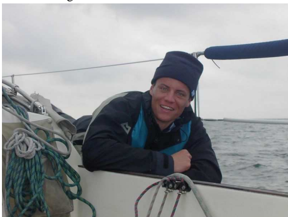
0500 Ansteuern von Mandal durch die Skärenküste Norwegens