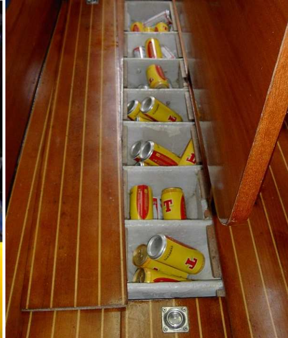
Das Abendprogramm in der Bilge