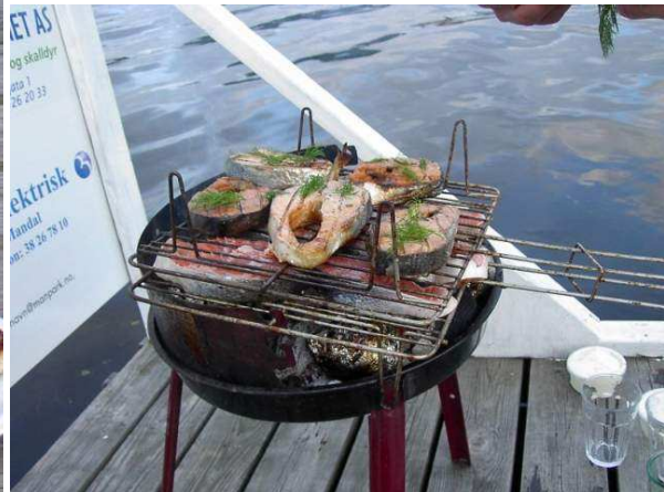
Lachs BBQ in Mandal auf dem Steg