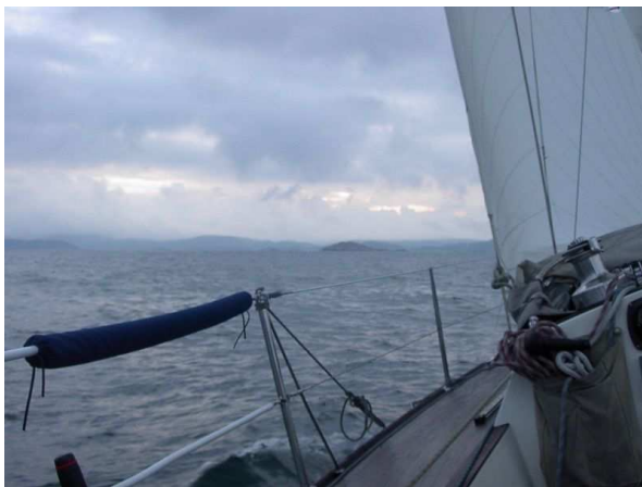
1900 Norwegische Küste und Leuchtturm Lindesnes in Sicht