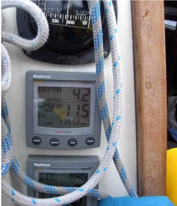
Top Speed 11.5 kn