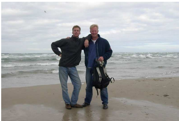
Wanderung zur Nordspitze

0645 an Skagen N 58° E 011° nach 136 sm in 21 Stunden (6,5 kn Schnitt)