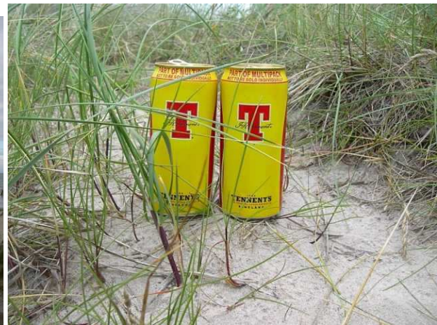
Zwei Schotten in Dänemark